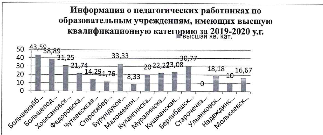
Рис. 2 Показатели высшей квалификационной категории в разрезе школ

Самые высокие показатели по наличию высшей квалификационной категории отмечаются в Большекайбицкой школе, Большеподберезинской, Бурундуковской и Хозесановской школах. В образовательных учреждениях с наименьшими показателями по высшей категории необходимо усилить выполнение методической задачи по обеспечению роста квалификации педагогических работников (рис.3,4).